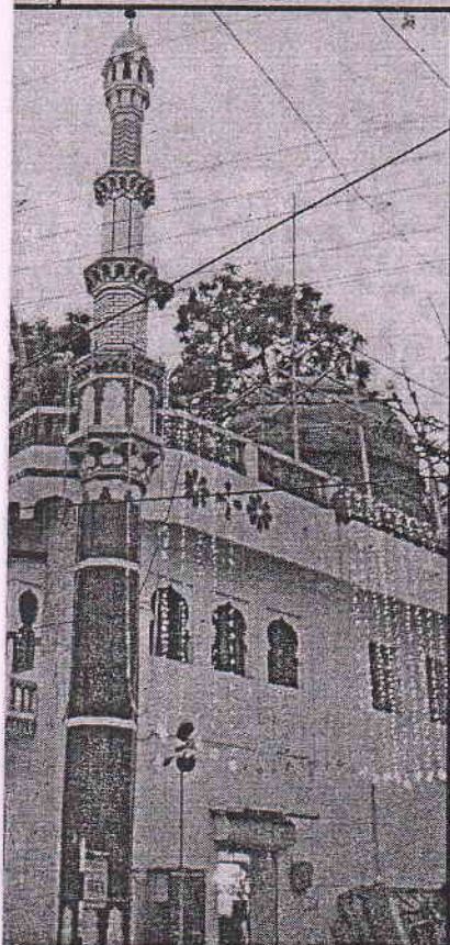
जामा मस्जिद में उर्स के पूर्व लाईटों से जगमगाती