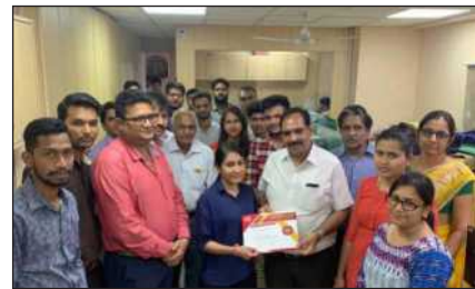
मेघना सोलंकी एक्जीक्यूटीव – क्रेडिट