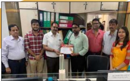
सीजो जोन सीनीयर एक्जीक्यूटीव – अकाउण्ट्स